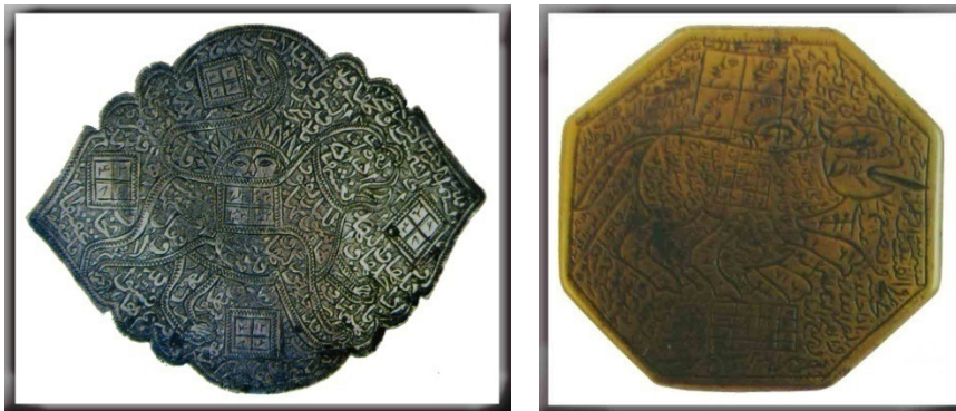
تصاویر (۶۵) دو بازوبند با نقش شیر و شیر و خورشید (تناولی، ۱۳۸۵: تصویر ۸۴ و ۸۶)

علاوه بر این صورت‌های فلکی را بر روی گروهی از طلسم‌ها نیز حک می‌کردند؛ به‌عنوان مثال بر روی طلسمی که طلسم دشمنی نامیده می‌شود، تصویر یک کژدم نقش بسته است. نمونه‌ی دیگری از طلسم‌ها یا تعاویذ را با عنوان بازوبند می‌شناسیم که طلسمی مردانه بود که آن را در زیر لباس و بر بازوی خود می‌بستند. معروف‌ترین بازوبندها، بازوبند «شیر و الشمس» است و چنانکه از نام آن پیداست بر روی آن نقش شیری حک شده و در داخل بدن شیر سوره‌ی «الشمس» نوشته شده است. این بازوبندها بیشتر از جنس فولاد ساخته می‌شدند، چون اعتقاد بر این بود که تماس آن با بدن باعث ازدیاد قدرت می‌شود (تناولی، ۱۳۸۵: ۷۰). علاوه بر ابزار ذکرشده، بر روی برخی از ظروف که جنبه‌ی طلسمی و جادویی داشتند نیز صورت‌های فلکی را می‌توان یافت. از جمله بشقابی که به بشقاب دوازده‌برج معروف است و دورتادور آن صور فلکی منطقه‌البروج حک شده است و در کنار آن‌ها و هم‌چنین در وسط ظرف نوشته‌ها و طلسم‌هایی مرقوم شده است.