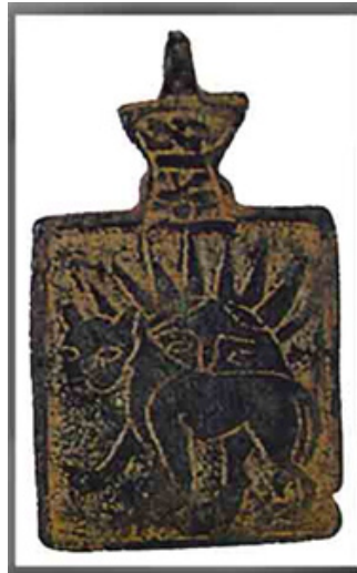
تصویر (۸) تعویذ با نقش شیر و خورشید (مادیسون و همکاران، ۱۳۸۷: شکل ۶۵)