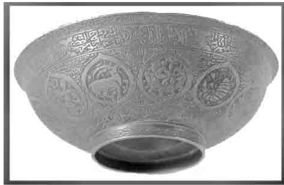
تصویر (۷). جام چهل‌کلید (موزه‌ی ایران باستان)

نقش شیر و یک خورشید تابان در پشت آن بر روی آویز و کتیبه‌ای کوفی بر پشت آن حک شده است. تعویذهایی نیز به شکل ماهی وجود دارد که بر روی آن اعداد سحرآمیز و کتیبه‌های غیر قرآنی و جداول جادویی حک شده است. آن‌ها احتمالاً نمادی از عاقبت به خیری و همچنین باروری بوده است (مادیسون و همکاران، ۱۳۸۷: ۱۰۸). همچنین این تعویذ به‌زعم معتقدان، خاصیت باران‌زایی دارند و این بارندگی، موجب سبزی و خرمی و آبادانی است و به همین جهت خواب‌گزاران می‌گویند که خواب دیدن ماهی خوش‌یمن است (ستاری، ۱۳۷۹: ۷۳).