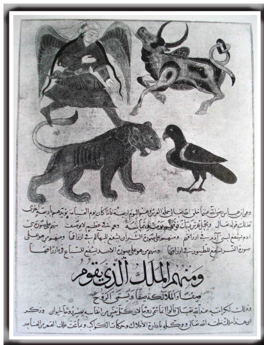
تصویر (۱۰) برگی از کتاب عجایب المخلوقات، سده ۸ ه.ق. (پوپ و همکاران، ۱۳۸۷: ص ۷۱۲)

اکنون چهارند و اعظم ایشان را وصف نتوان کرد و چون قیامت شود چهار دیگر با ایشان ضم شود قوله تعالی و یحمل عرش ربک یومئذ ثمانیه و آن ملک که بر صورت بنی‌آدم است از بهر بنی‌آدم دعا کند و آنکه بر صورت ثور است از بهر بهایم و آنکه بر صورت نسر است از بهر مرغان و آنکه بر صورت شیر است از بهر سباع (قزوینی، ۱۳۶۱: ۵۵-۵۴). توصیف این چهار صورت دقیقاً برابر با توصیفات است که برای کروبیان در کتاب حزقیل پیامبر آمده است. این چهار فرشته با صورت‌های فلکی گاو، شیر، عقرب (عقاب) و مرد آب‌ریز قابل تطبیق هستند.