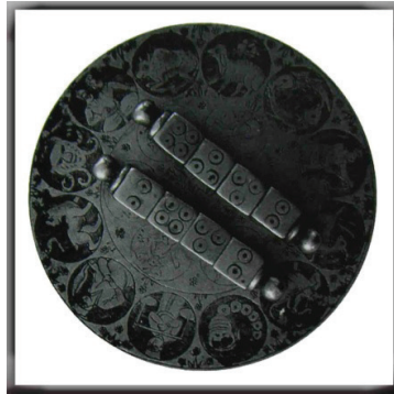
تصویر (۱). تخته‌ی رمل. (تناولی، ۱۳۸۵: تصویر ۴۸)

ایرانیان نیز از دیرباز با علوم غریبه و طلسمات آشنا بوده‌اند و در این زمینه آثار زیادی به جای گذاشته‌اند. نکته‌ی قابل ذکر دیگر این است که آگاهی به علم «رمل» از واجبات علوم غریبه و طلسمات محسوب می‌شد. عمل رمل زدن با ریختن تاس‌ها بر تخته‌ی رمل انجام می‌شد. این تخته، یک صفحه‌ی برنجی مدور بود که تصاویر دوازده‌برج را بر آن ترسیم می‌کردند. ابزاری همچون «اسطرلاب» و «قطب‌نما» نیز مورد استفاده‌ی رمالان قرار می‌گرفت که نشان می‌دهد هرچند هدف این علم دسترسی به مجهولات عالم و استعلام خیر و شر وقایع بود، اما مسیر و مراحل دستیابی به آن، مستلزم تسلط بر علوم نجوم و ریاضیات بود. صورت برج‌های فلکی به شکل حجم‌های کوچک فلزی نیز ساخته شده است.