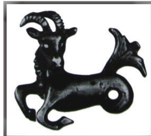
تصاویر (۳ و ۲). دو طلسم به شکل صورت‌های فلکی. (تناولی، ۱۳۸۵، تصویر ۳۱ و ۳۲)