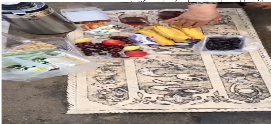
تصویر ۲: نذر خوراکی بر مزار درگذشته.

در واقع می‌توان نتیجه گرفت نوعی رابطه دوطرفه، میان شخص درگذشته و بازماندگان برقرار است. این‌گونه که ابتدا بازماندگان به دیدار درگذشته می‌روند سپس روز بعد شخص درگذشته از منزل دیدار می‌کند. وجود چنین نگرشی، باور آن‌ها به تأثیر درگذشتگان در زندگی دنیوی‌شان را نشان می‌دهد و به همین دلیل برای جلب رضایت و همکاری آن‌ها اقداماتی صورت می‌گیرد.