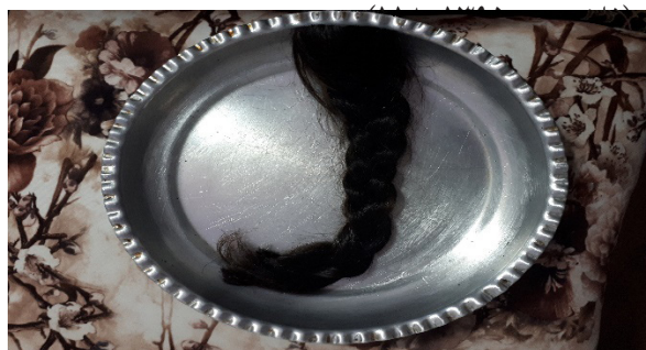
تصویر ۳: گیس بریدن.

گاه زنان هنگام مرگ یا حادثه‌ای ناگوار، همچون امراض صعب‌العلاج فرزندان یا وقوع مصیبتی برای نزدیکان در حال پریشانی عضوی از بدن یا گیسوان (نماد قدرت و حیات) خود را برای شفای بیمار یا دفع حادثه ناگوار نذر می‌کردند و معتقد بودند اگر نذر یا سوگند خود را آدا نکنند، سرنوشت شومی در انتظارشان است به همین دلیل بعد از شفای بیمار یا رسیدن به مقصود، گیسوان خود را می‌بریدند. در کتاب رفتارشناسی ایرانیان نیز به این رسم اشاره شده است: «در میان برخی ایل‌های ایلام و کرمانشاه هنگام مرگ، زنان موی خود و یال اسبان را می‌برند و صورت‌ها را با ناخن می‌خراشند»